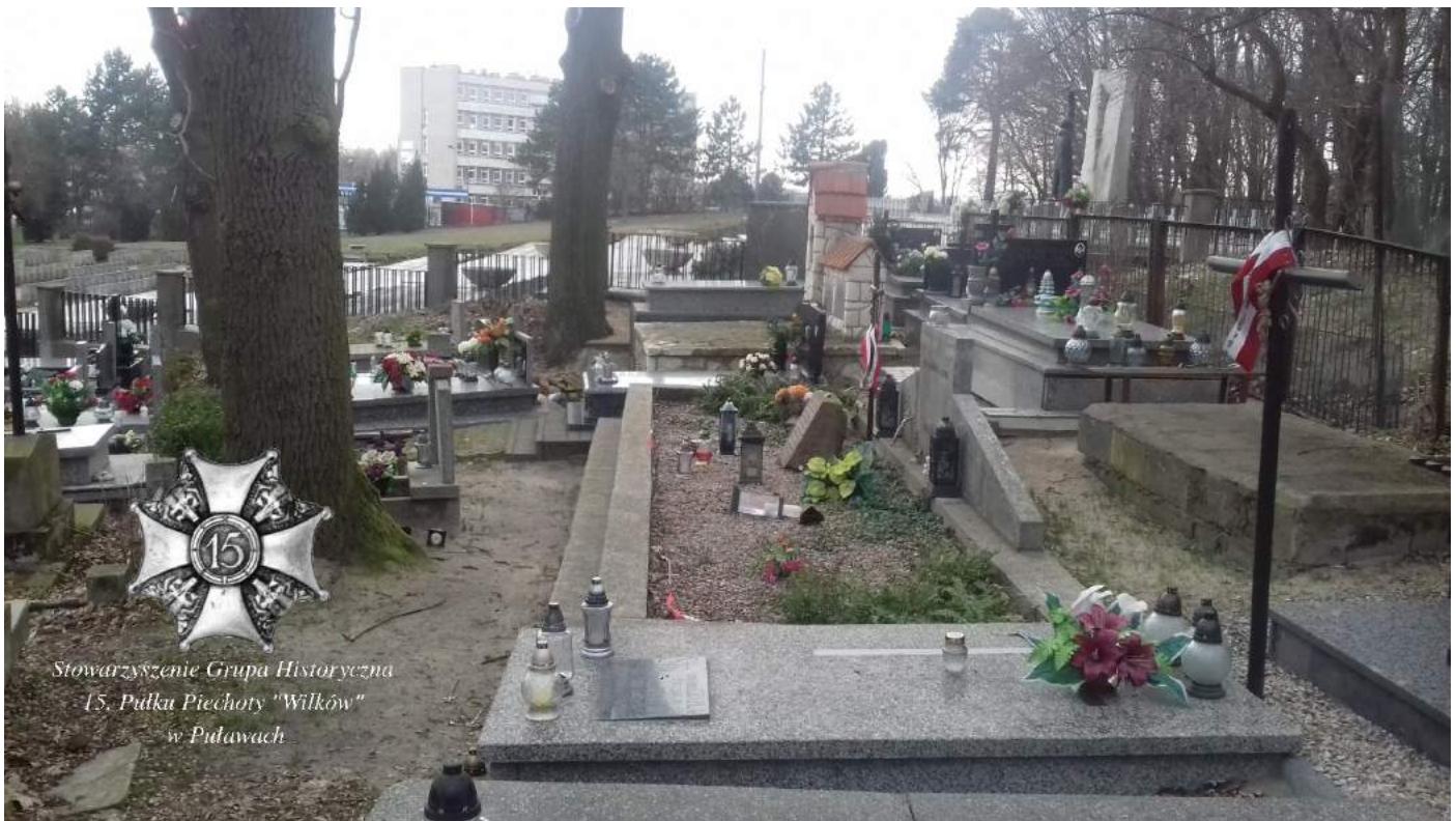
Stowarzyszenie Grupa Historyczna 15. Pułku Piechoty "Wilków" w Puławach